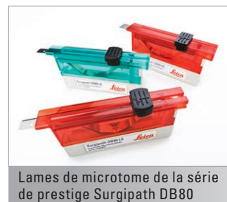
Lames de microtome de la série de prestige Surgipath DB80