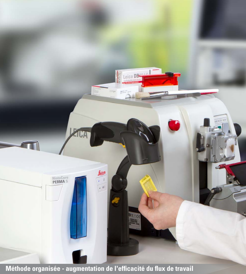
Méthode organisée - augmentation de l'efficacité du flux de travail