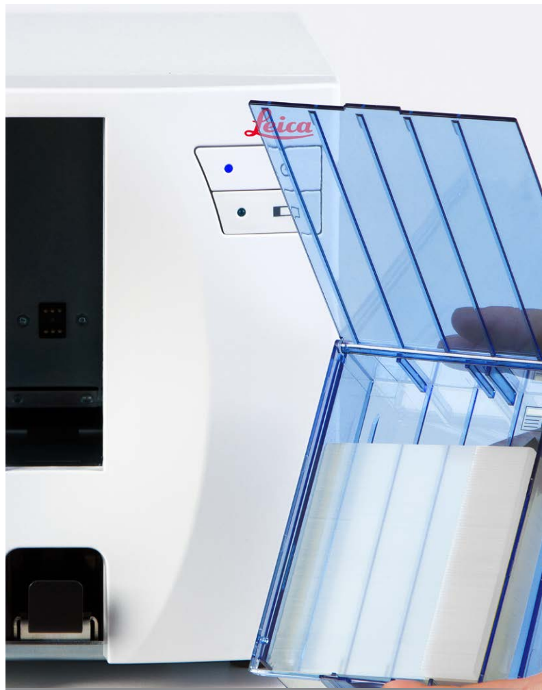
Efficacité - remplacement rapide et chargement aisé du chargeur de lames