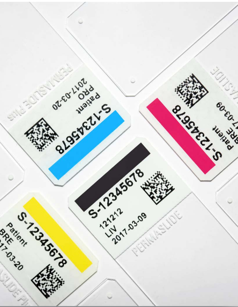
Qualité - les lames homologuées assurent une impression thermique homogène