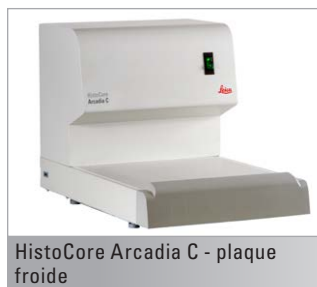
HistoCore Arcadia C - plaque froide

Grâce à un vaste éventail d'instruments histologiques et de consommables appropriés, Leica Biosystems permet à votre laboratoire de bénéficier d'une solution complète.