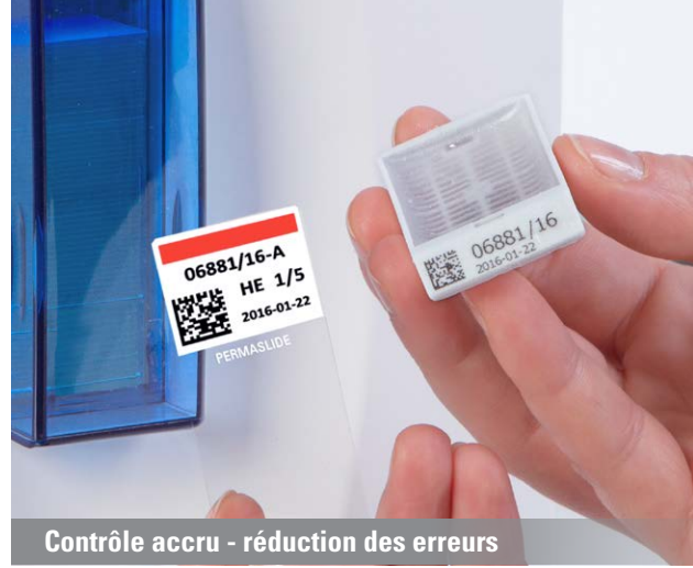
Contrôle accru - réduction des erreurs